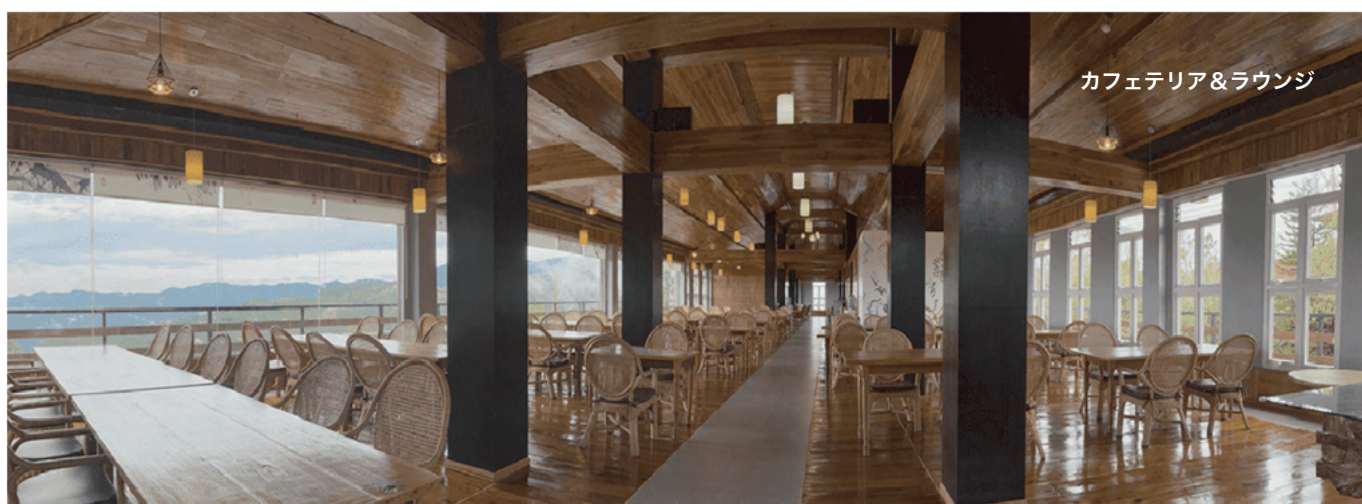
カフェテリア&ラウンジ