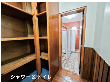
シャワー & トイレ