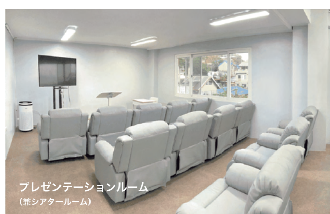
プレゼンテーションルーム (兼シアタールーム)