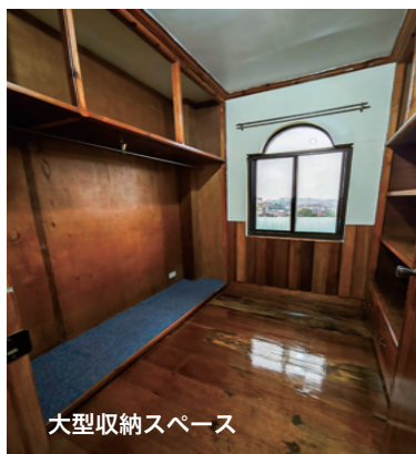
大型収納スペース