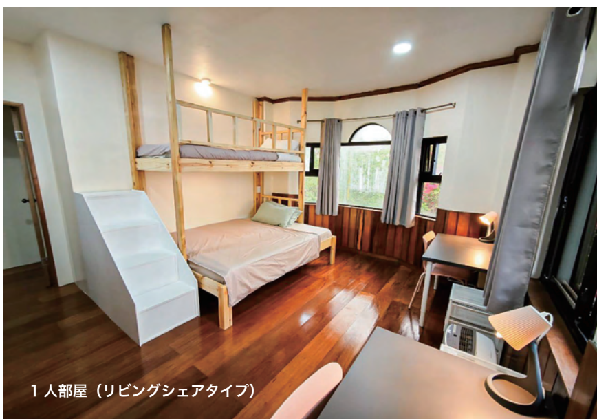
1 人部屋 (リビングシェアタイプ)