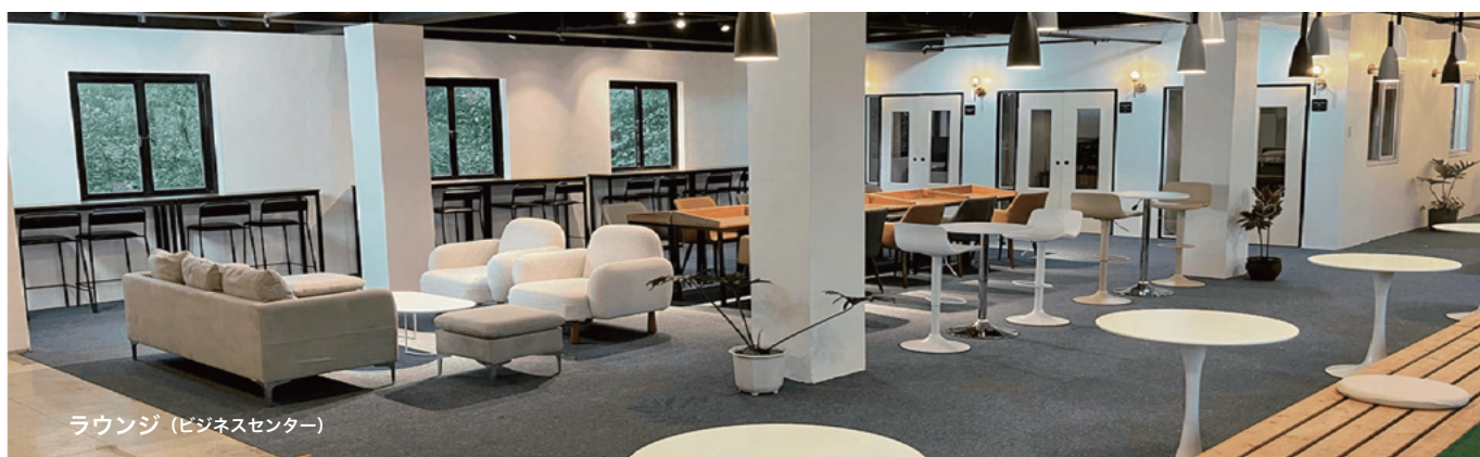
ラウンジ (ビジネスセンター)