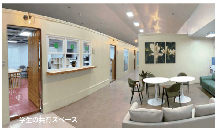
学生の共有スペース