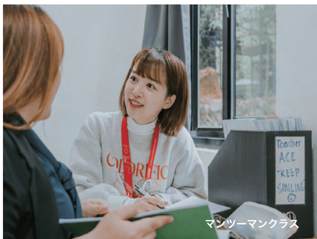
マンツーマンクラス